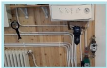
Parete attrezzata alla tecnica Manta Ecologica